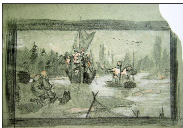
Н.К. Рерих. Нежданные гости. 1897.

Публикуется по изданию: Переписка Н.К. Рериха со Стасовым В.В. М. Директ-Медиа. 2001 г. 67 с.