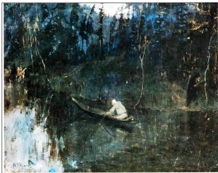
Н.К. Рерих. По реке. Гонец (эскиз). [1996-97].