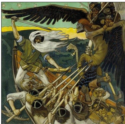
Аксель Галлен. Сампо (Из «Калевалы»). 1896.

ловину её) выставка должна была обозреть русское искусство, уяснить задачи его, дать тон дальнейшему росту его. На деле же вместо обзора вышла какая-то неожиданная ревизия русскому искусству, все петербургские выставки, пополненные немногими известными произведениями, ничтоже сумняшеся, перекочевали в Нижний. Передвижники, при высоком уровне прошлогодней выставки, имели на это основание. Не могут оправдаться этим же Общество Петербургских Художников, Академия и акварелисты. Если вещь остаётся у художника, то это ещё не повод помещать её на Всероссийской выставке, имеющей всемирное значение. Единственной новостью является отдел финляндских художников. Ярким примером скверных последствий увлечения символизмом могут служить картины г-на Акселя Галлена «Conceptio artis» и «Probleme» (ничего кроме смеха не возбуждающая), а между тем г. Галлен человек талантливый, как это можно видеть по выставленным тут же сильным «Айно» и «Сампо» (из «Калевалы»). Вещи Эдельфельта были и на академической выставке.