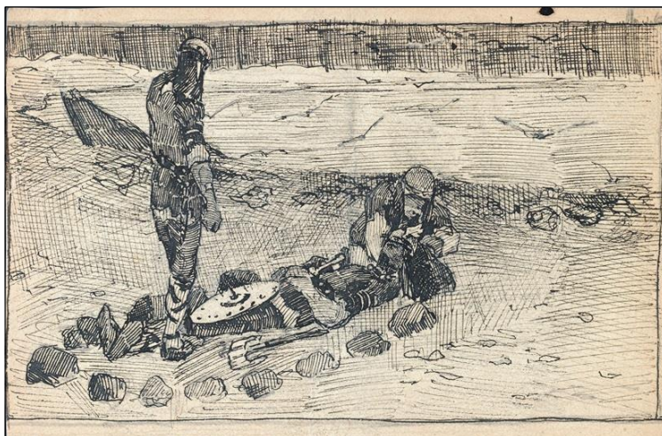
И.К. Рерих. На чужом берегу. 1897. Эскиз к одноимённой картине.