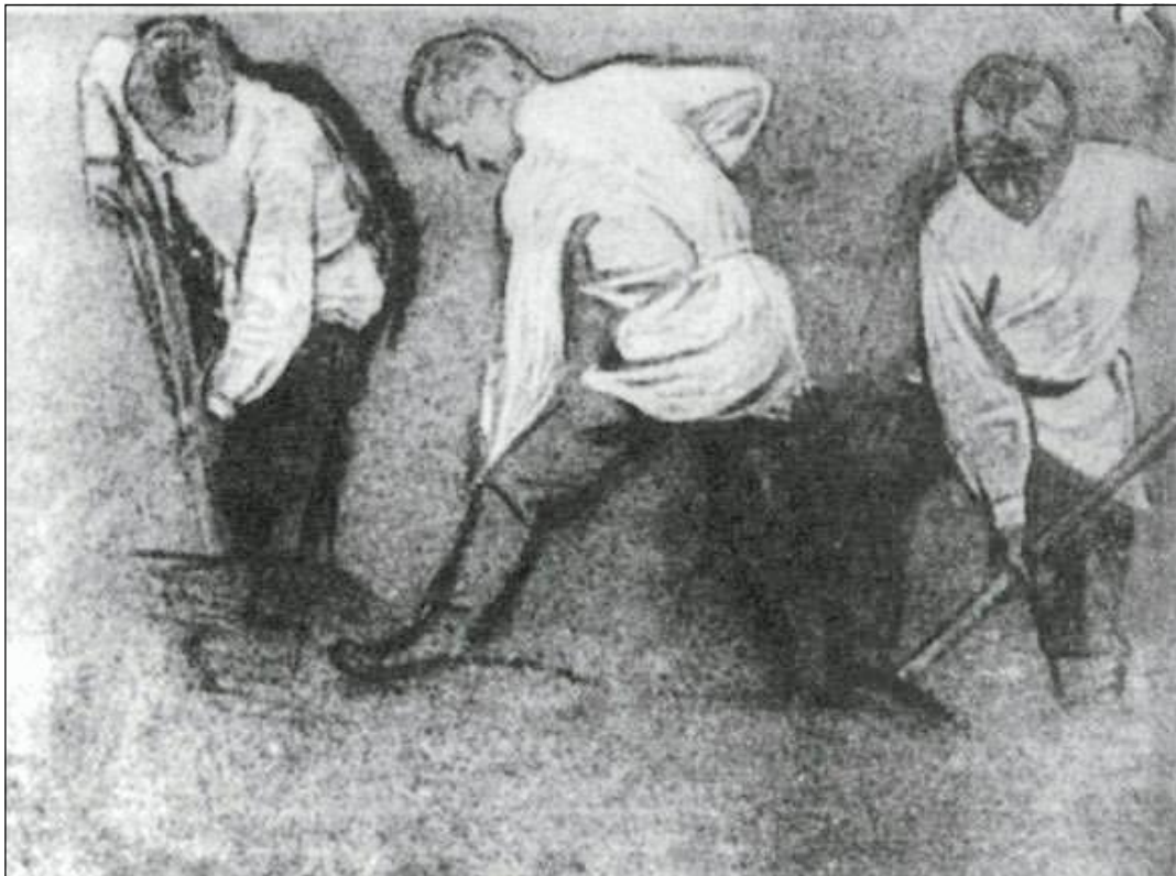
Н.К. Рерих. Землекопы. [1890-е].

Новое время. 1896 г. 31 октября/ 12 ноября. № 7428.